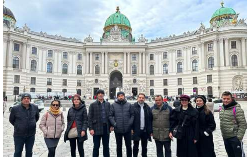
VIYANA ÖĞRETMEN İŞBAŞI GÖZLEM HAREKETLİLİĞİ (19-25 ŞUBAT)