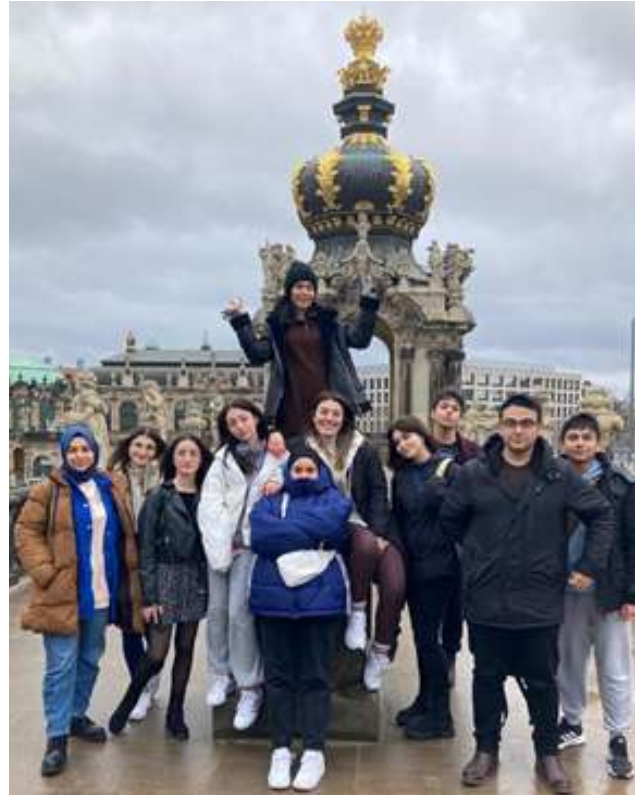
PRAG ÖĞRENCİ HAREKETLİLİĞİ (19-25 ŞUBAT)