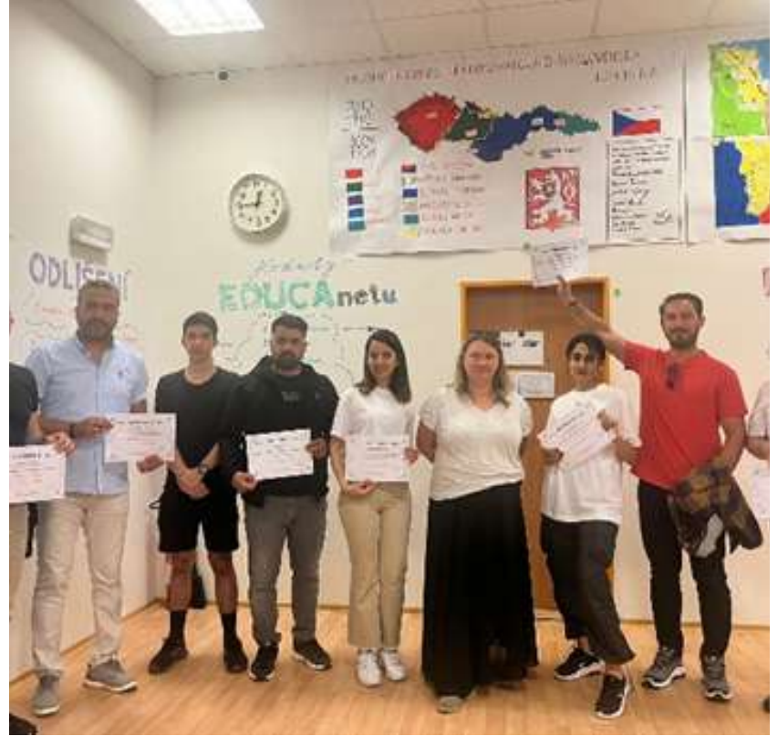
BUDAPEŞTE ÖĞRETMEN KURS HAREKETLİLİĞİ (7-13 MAYIS)