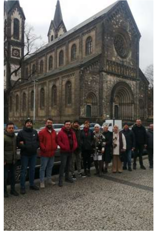
PRAG ÖĞRETMEN İŞBAŞI GÖZLEM HAREKETLİLİĞİ (12-18 ŞUBAT)