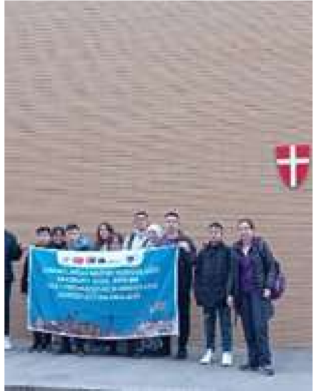
VIYANA ÖĞRENCİ HAREKETLİLİĞİ (12-18 MART)