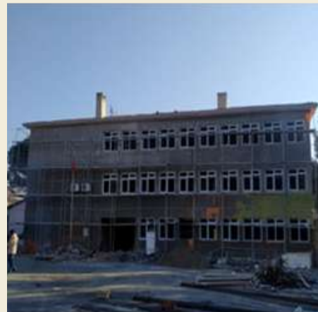
KARGI YUNUS EMRE İLKOKULU