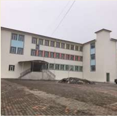
İSKİLİP MİSAKİMİLLİ İLKOKULU