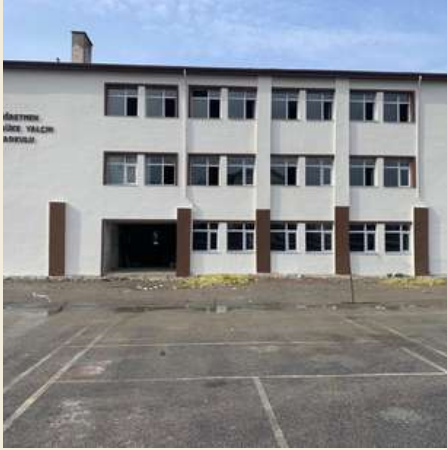
OSMANCIK ŞENAY AYBÜKE YALÇIN ORTAOKULU